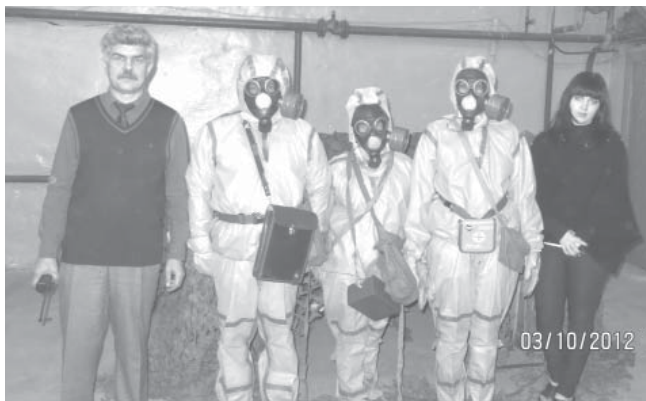
Учения штаба ГО и ЧС