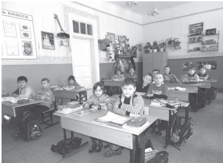
Ученики школы №33