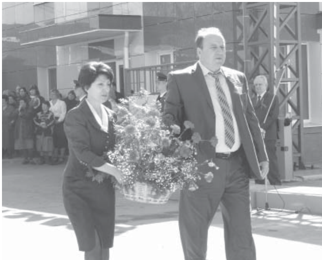
Корзина к обелиску - от администрации и профкома

Дорогой ценой нам досталась Победа. Погибли лучшие люди того поколения самых разных национальностей. Плечом к плечу они боролись с врагом, объединенные