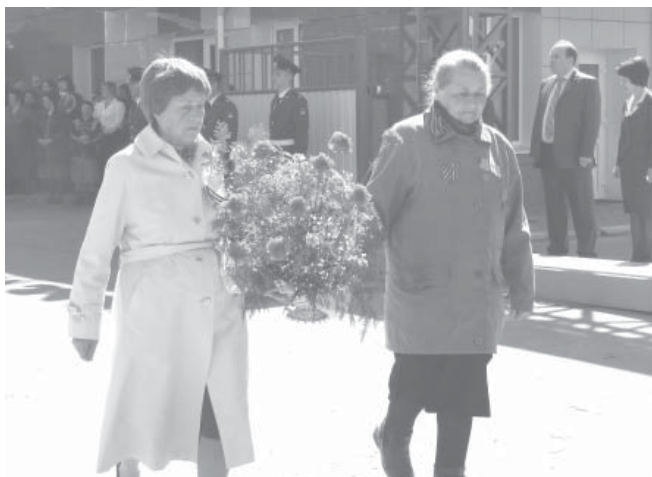
День памяти от труженников тыла

подшефных школ, воспитанники детского сада №90 и другие гости. Почетные места заняли, конечно же, ветераны.