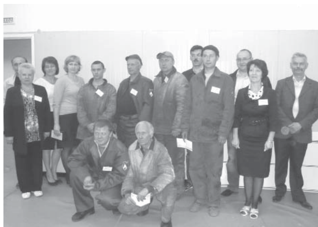
Участники конкурса и члены жюри

с победой, а всех сварщиков с профессиональным празд-