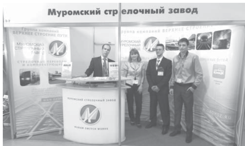
Экспозиция МСЗ на выставке «ЭлектроТранс 2013»