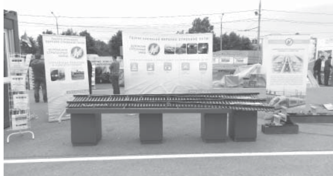
Экспозиция МСЗ на выставке «Покупай Владимирское»

Наше предприятие участвовало в данном форуме и в выставке с экспозицией.