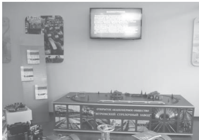
Экспозиция МСЗ на выставке «Промышленный потенциал Владимирской области»

вершилась совсем недавно. На этой выставке в течение предыдущих десяти лет была