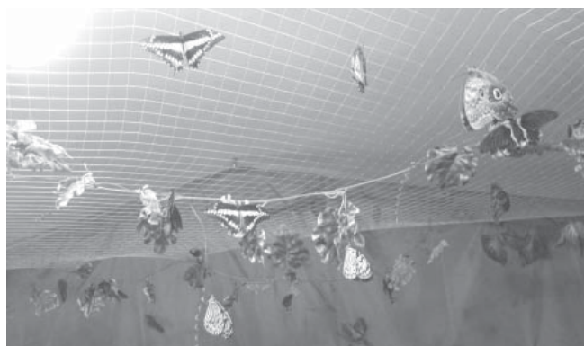
Экспозиция «Живые тропические бабочки»

туристы, искатели приключений или учёные мужи пытались постичь и разгадать тайны великой древней цивилизации. Организаторы выставки «Египетские мумии. У истоков времен» дали шанс муромлянам прикоснуться к некоторым из них и перенестись в тот далекий полный загадок и тайн мир. Всем из-