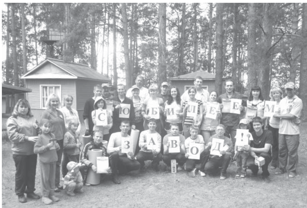
Участники туристического слета

так не хватало, или же наша проблема окажется настоль-