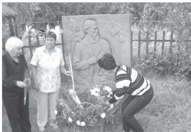
У мемориальной доски

ховца, Гусь-Хрустального, Рязанской области участвовали в фестивале.