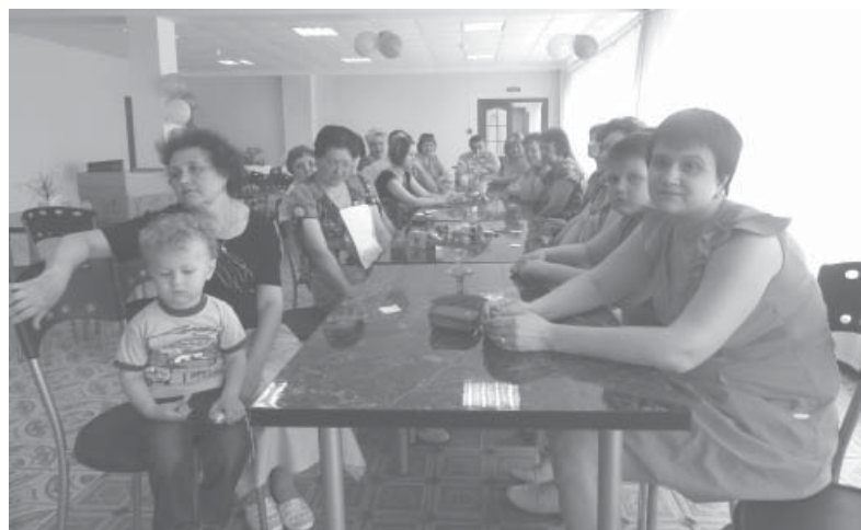
Коллектив медико-санитарной части