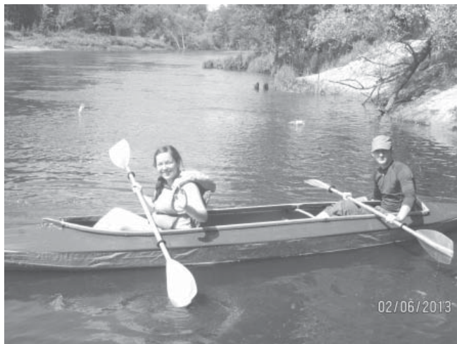
Соревнования на байдарках

ние на байдарках водного участка с преодолением ворот, которые были отмечены на воде буйками.