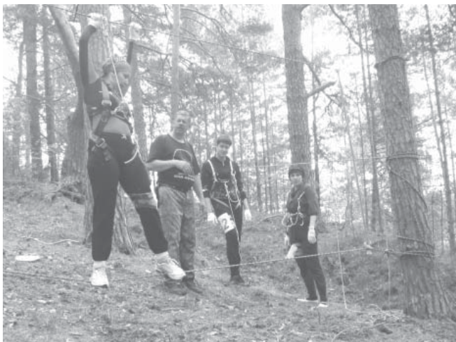
Момент прохождения полосы препятствий

неурядицах и забываем, что иногда просто необходимо отдохнуть. И когда мы вернемся с новыми силами и зарядом положительных эмоций, возможно, к нам придет то необходимое решение, которого