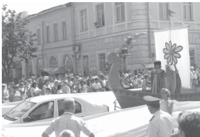
Ладья семейного счастья

Молодые родители откликнулись на призыв Ко-