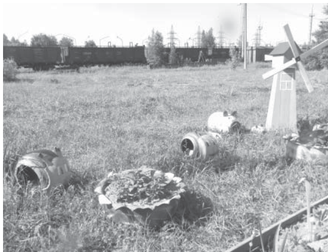
Зона отдыха механического цеха

Очень обидно, что некоторые цеха сдали свои позиции, особенно в этот юбилейный для ОАО «МСЗ» год. Впрочем, до второго этапа смотр-конкурса у них еще остается время наверстать упущенное, и пусть не разведением клумб, так приданием своим зонам отдыха очарования при помощи различных поделок и ярких красок. Но не забывайте, что