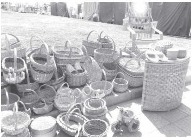
На ремесленной ярмарке

сказала о том, что впервые в Муроме в этом году организован пресс-центр, где журналисты во время праздника могли пере- вести дух, собраться с