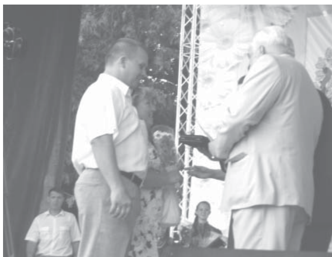
Награждение семьи Запретиловых

Завершился праздник большим трехчасовым концертом на набережной Оки. В нем традиционно приняли участие эстрадные звезды первой величины, такие как Лев Лещенко,