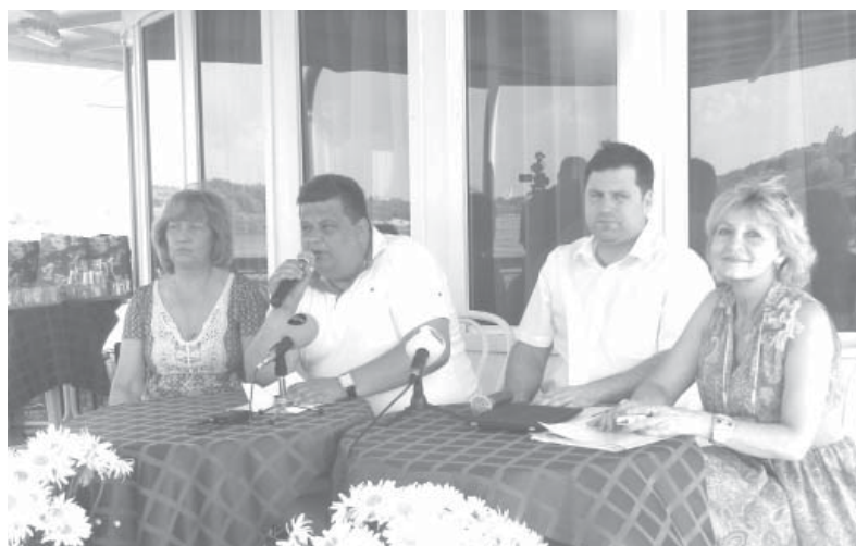
Пресс-конференция на теплоходе