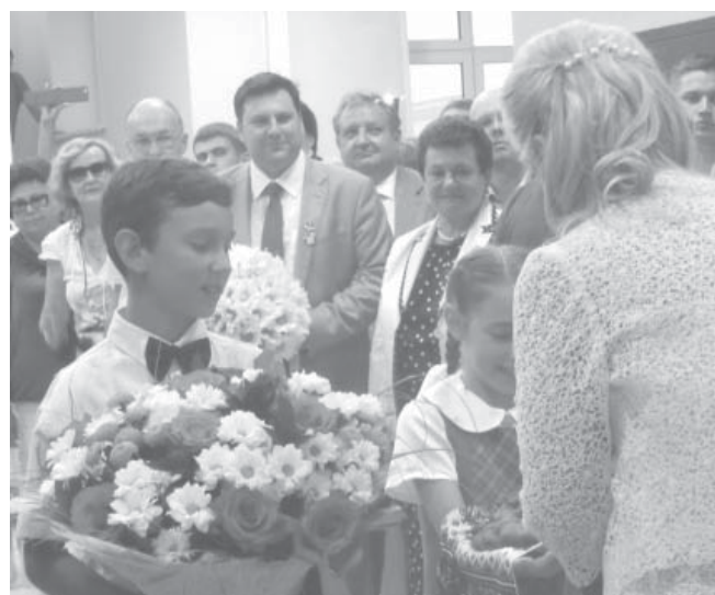
Открытие Православной гимназии

более пятнадцати ребят. На данный момент конкурс на одно учебное место составляет 6-7 человек. В