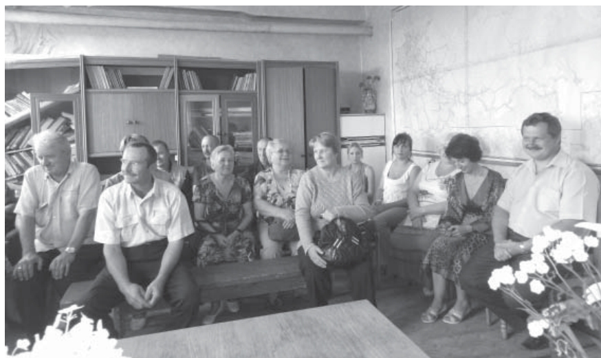
Коллектив цеха №401

небольшие подарки. Получить призы смогли и остальные гости, которые ответили на вопросы небольшой профессиональной викторины. Добро-