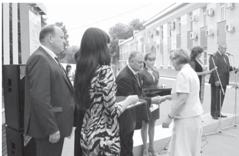
Награждение лучших работников предприятия