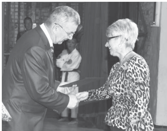
Награждение Почетной грамотой дорожного комитета профсоюза на ГЖД