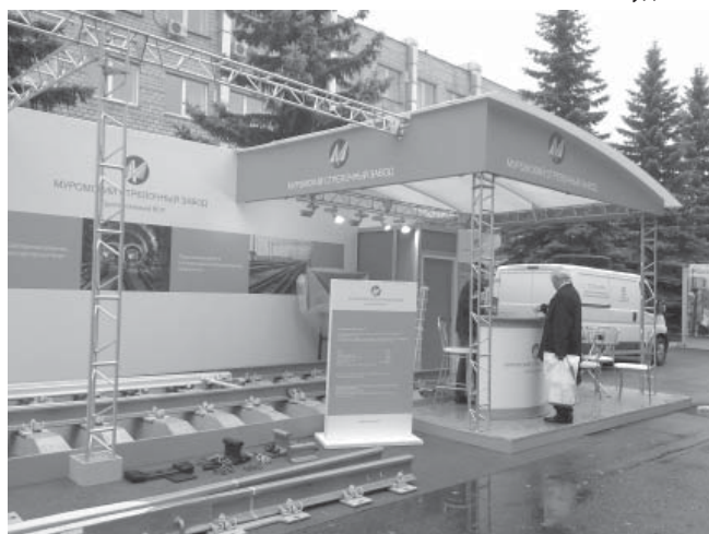
Экспозиция Муромского стрелочного завода

предложения, обменивались контактами, заключали договора. Тринадцатого сентября многие преподаватели привели на ЭКСПО 1520 своих студентов