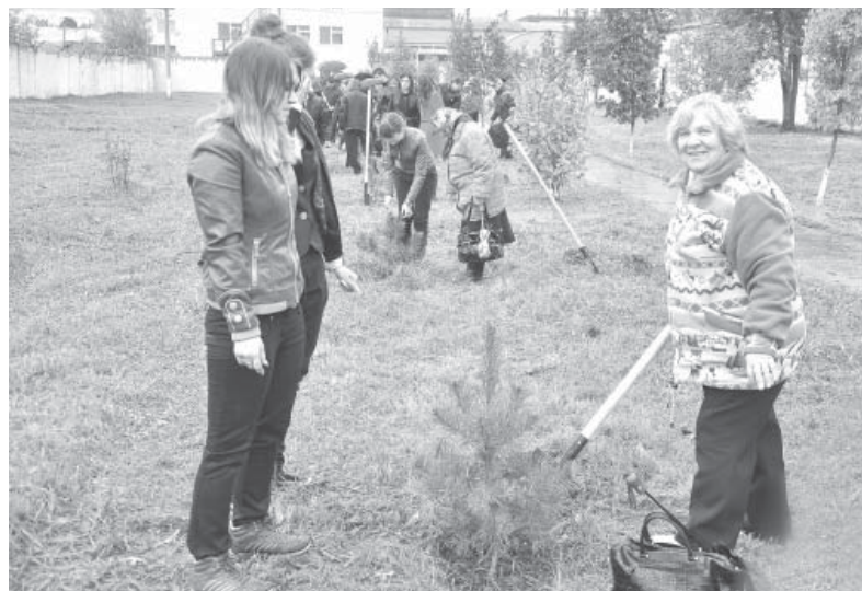
Посадка аллеи трудовой славы