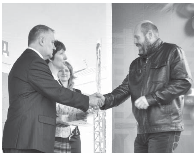
Награждение заводской грамотой

В рамках этого мероприятия были подведены итоги заводского смотра-конкурса «Мы. Время. Завод», посвященного 85-летию юбилею