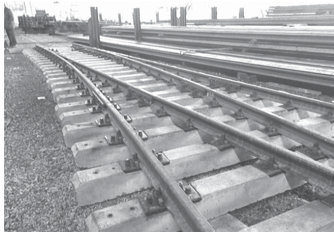
Стрелочный перевод типа Р50 марки 1/5 проекта ВСП05

парковых путях метрополитена эксплуатируются стрелочные переводы типа