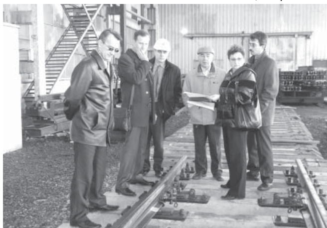
Результат приемки показал, что стрелочный перевод отвечает всем заявленным требованиям

новый стрелочный перевод можно будет запускать в серийное производство.