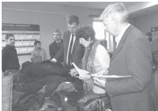
Спецодежду оценивали по определенным критериям

шим критериям (качество ткани, удобство и надежность покроя, расположение и качество пуговиц и так далее).