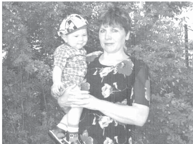
Татьяна Александровна с внуком