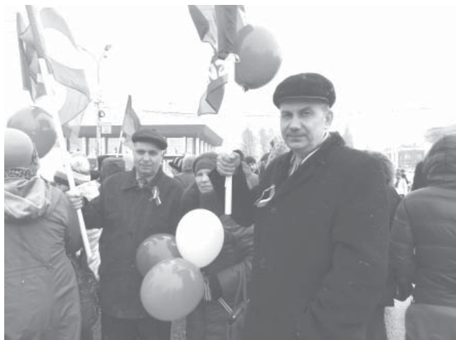
Представители МСЗ на митинге

ников митинга в поддержку Крыма. В центре Владимира торжественное событие истинно исторического масштаба праздновали жители из многих уголков Влади-