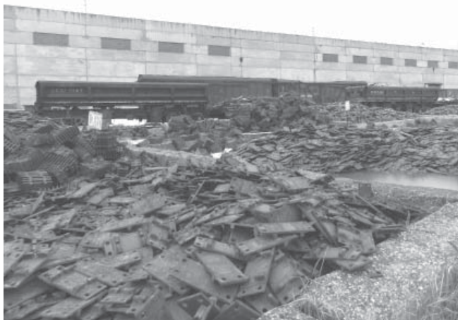
Накладки для комплектовки

стрелочном заводе машинистом крана в 201 и 401 цехах, сейчас же трудится в агентстве недвижимости.