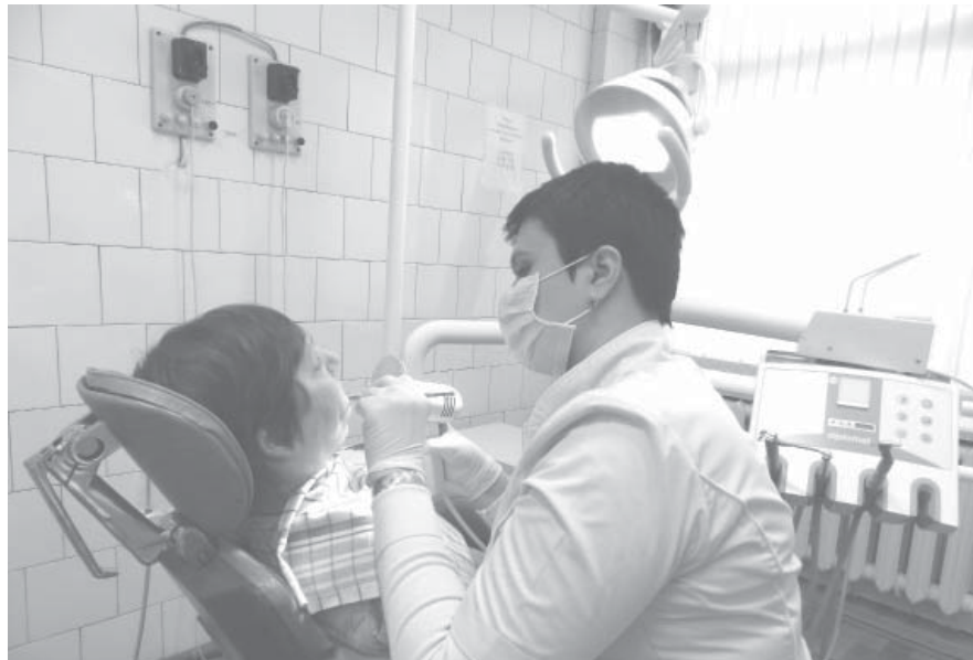
На приеме у стоматолога

также появилось много новых лекарств и других медицинских принадлежностей.