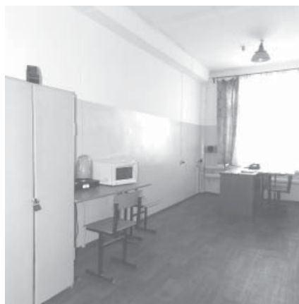
Ремонт в помещениях цеха №402

хорошие слова они могут сказать в адрес тех специалистов, которые занимаются на данный момент в подраз-