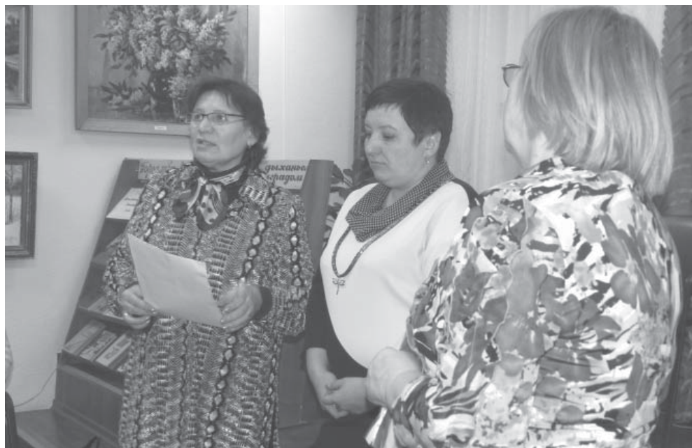
Главного редактора нашей газеты рекомендуют в союз журналистов

ся рекламой и сувенирной продукцией Муромского стрелочного завода. Стоит